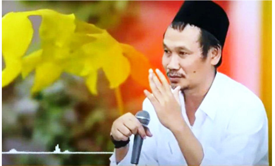
KH Ahmad Bahauddin Nursalim Rais Syuriyah Pengurus Besar Nahdlatul Ulama (PBNU)

Seseorang yang bergelut dengan ilmu pengetahuan dan banyak membaca, maka tidak akan kaget dengan yang namanya perbedaan. Hal itu disampaikan Rais Syuriyah Pengurus Besar Nahdlatul Ulama (PBNU), KH Ahmad Bahauddin Nursalim atau yang akrab disapa Gus Baha.