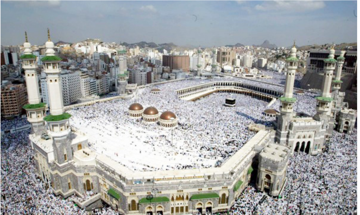
Puncak Ibadah Haji 2023 di Mekah

Selain itu, Komisi VIII DPR mendorong Pemerintah melakukan sosialisasi dan edukasi yang masif bika hendak merealisasikan kebijakan berhaji sekali seumur hidup. Ace meminta Pemerintah membuka peluang lain bagi umat muslim yang hendak beribadah di Tanah Suci lebih dari satu kali, misalnya dengan kemudahan akses umrah.