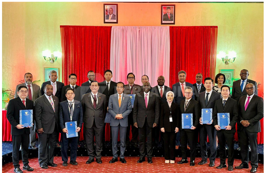
Presiden Republik Indonesia Joko Widodo, Menteri Koordinator Bidang Kemaritiman Luhut Binsar Pandjaitan dan Direktur Utama Pertamina (Persero) Nicke Widyawati bersama rombongan Pertamina saat melakukan kunjungan ke Kenya, Afrika.