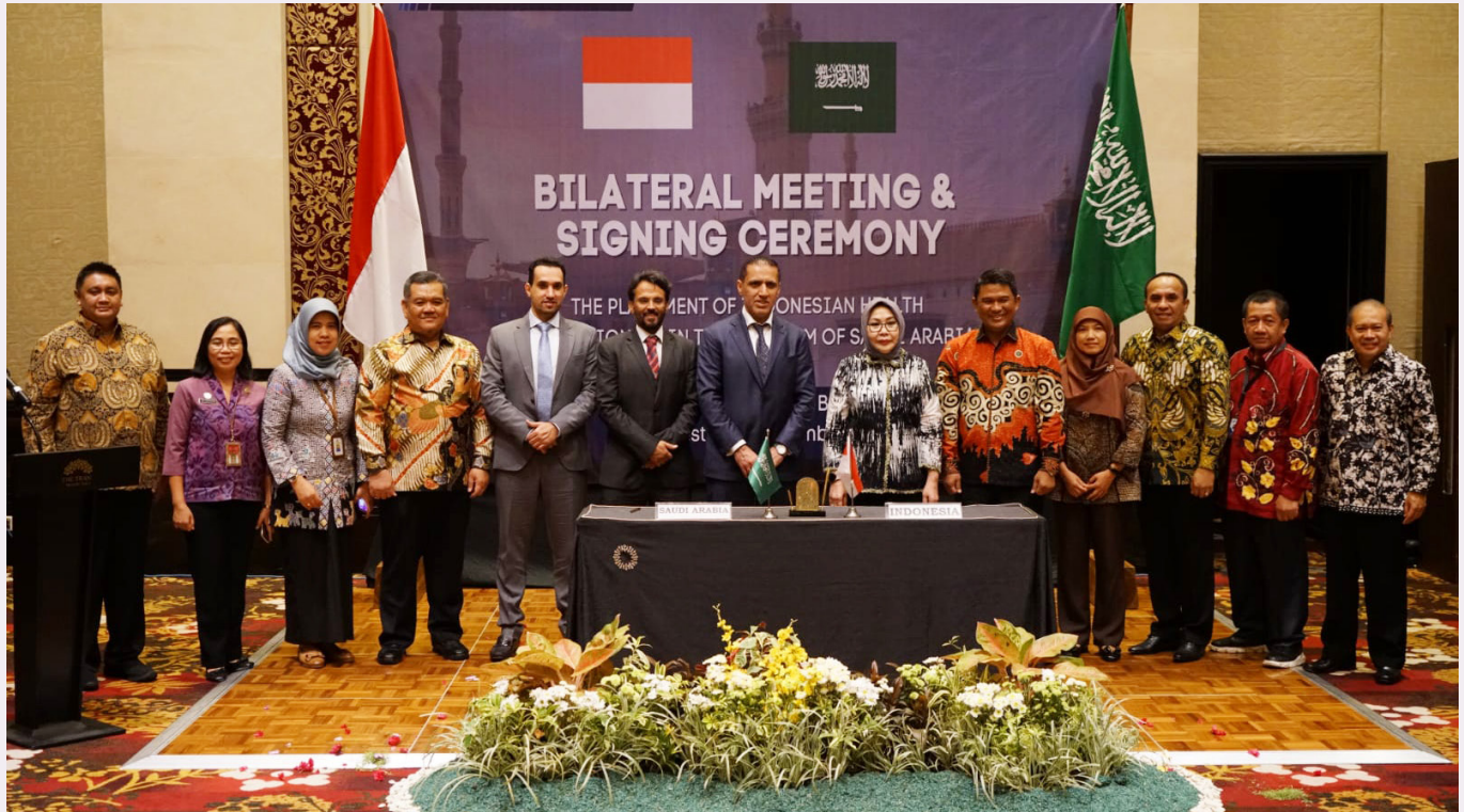
MoU pengiriman tenaga kesehatan RI ke Kerajaan Arab Saudi