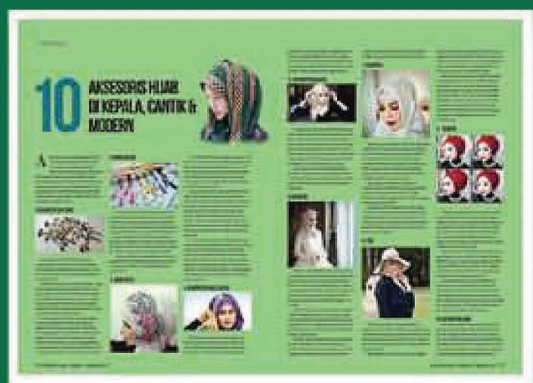
IKLAN CENTER SPREAD FC Rp. 80.000.000