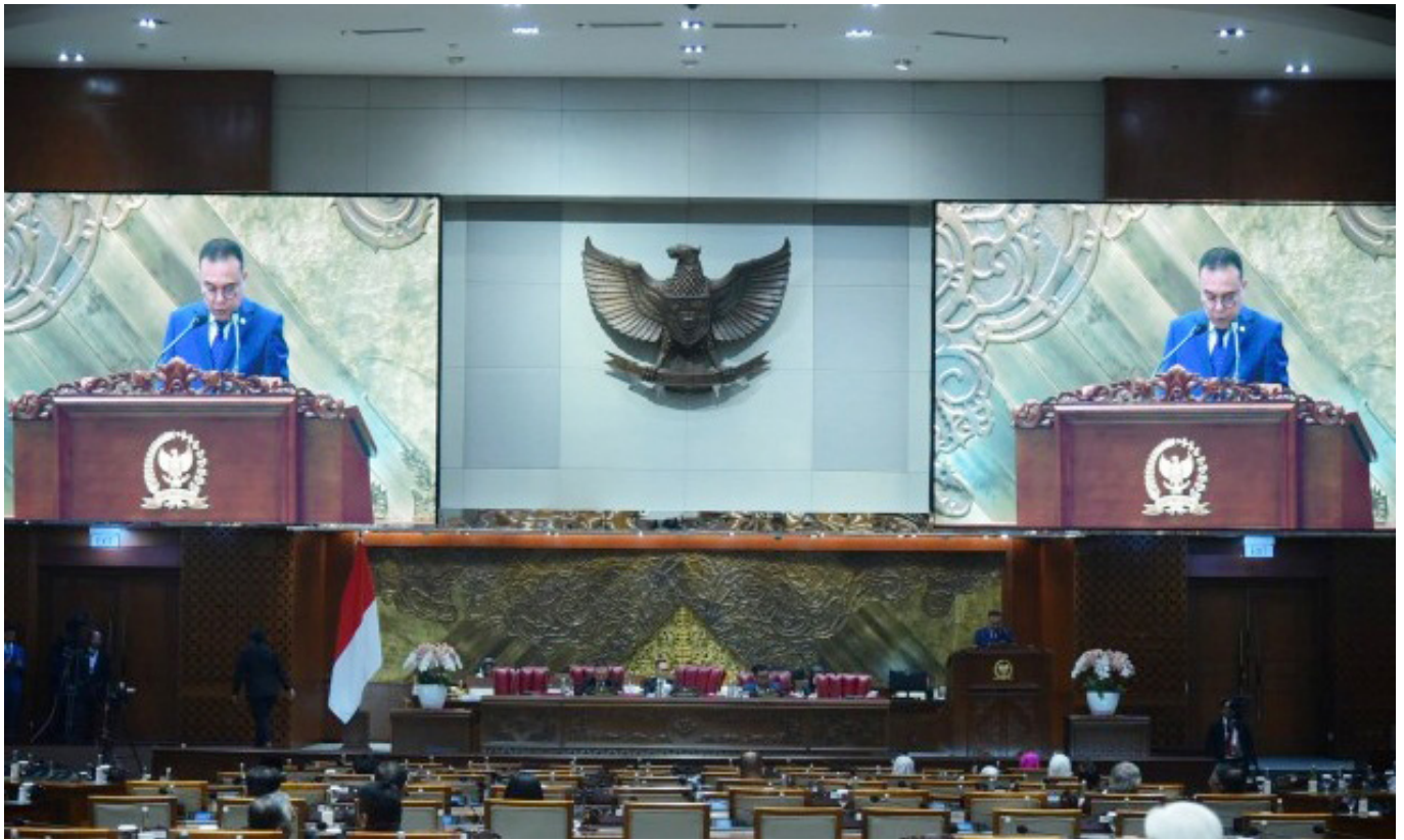
Wakil Ketua DPR RI Koordinator Bidang Ekonomi dan Keuangan Sufmi Dasco Ahmad saat memimpin Sidang Paripurna ke-7 Masa Persidangan I Tahun Sidang 2023-2024.