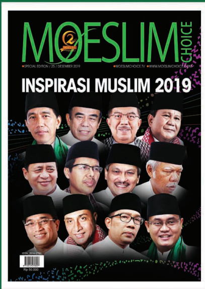
IKLAN 1 HALAMAN FC Rp. 50.000.000