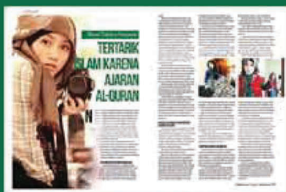
IKLAN 1/2 HALAMAN FC Rp. 25.000.000