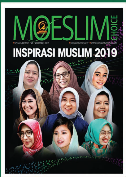
IKLAN BACK COVER FC Rp. 75.000.000