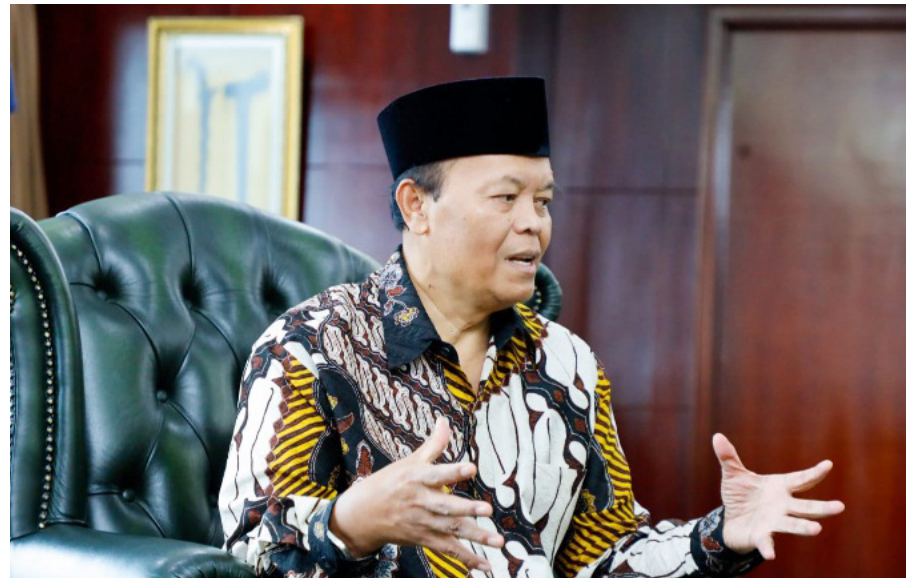
Wakil Ketua MPR RI, Hidayat Nur Wahid

"Rekomendasi itu sudah tepat untuk menjawab kebutuhan pesantren untuk di-