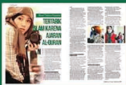
IKLAN 1/2 HALAMAN FC Rp. 25.000.000

Media Yang Tepat Untuk Promosi Usaha Anda