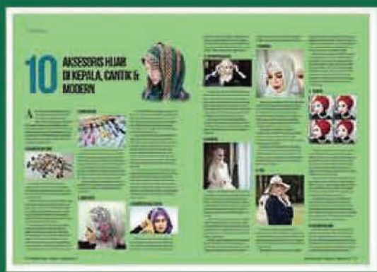
IKLAN CENTER SPREAD FC Rp. 80.000.000