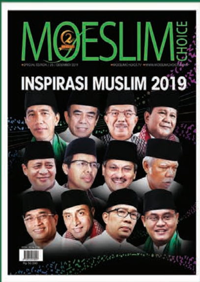
IKLAN 1 HALAMAN FC Rp. 50.000.000