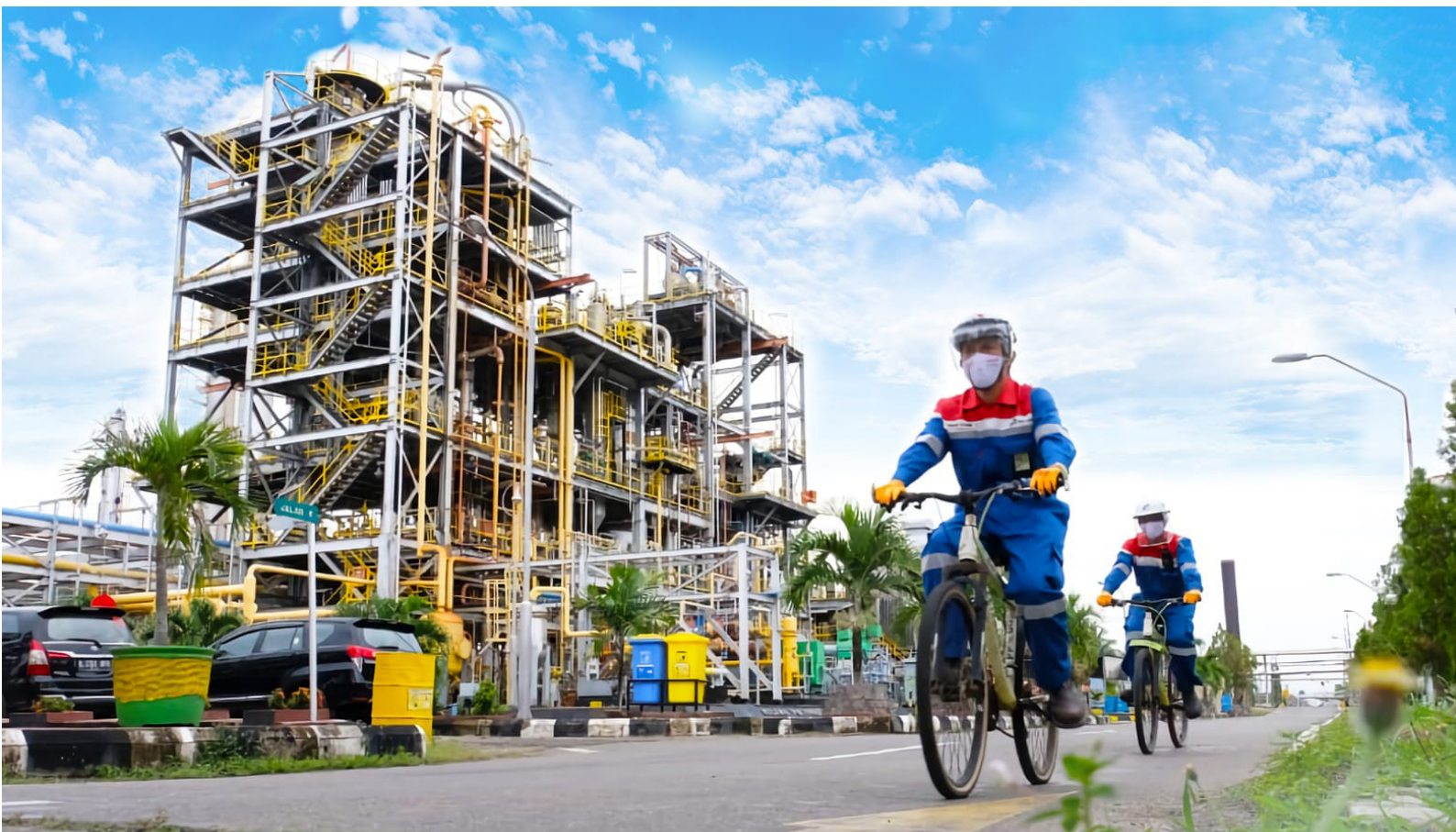
Direktur Utama Pertamina Nicke Widyawati.

men dalam mendukung target Net Zero Emission 2060 dengan terus mendorong program-program yang berdampak langsung pada capaian Sustainable Development Goals (SDG's). Seluruh upaya tersebut sejalan dengan penerapan Environmental, Social & Governance (ESG) di seluruh lini bisnis dan operasi Pertamina. ♦