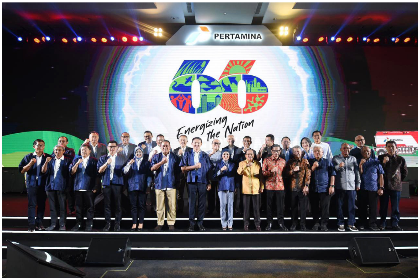
Perayaan puncak milad Pertamina ke-66.

Hingga Oktober 2023, PT Pertamina Hulu Energi (PHE) selaku Subholding Upstream berhasil mencapai produksi melebihi 1 Juta BOEPD (Barel Minyak Ekuivalen/ Setara Minyak per Hari). Kontribusi nasional PHE juga semakin signifikan atas lifting minyak sebesar 86% dan gas sebesar 32%. PHE juga berperan dalam pengembangan