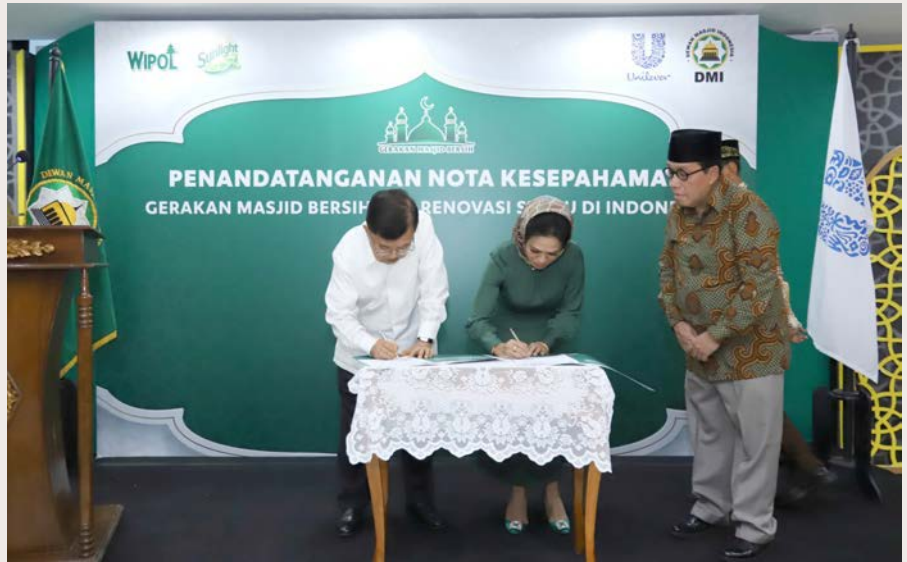
Gerakan Masjid Bersih 2024 - Penandatanganan MoU dengan DMI

Tak lupa ia juga berharap, bahwa program ini akan terus memainkan perannya dalam menyebarkan kebaikan dan kemaslahatan bagi umat Muslim di Indonesia. ♦ red