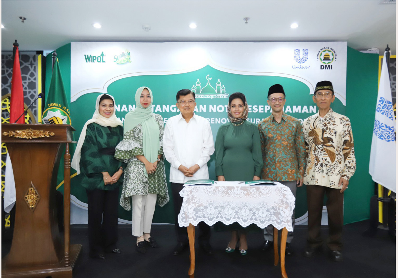
Gerakan Masjid Bersih 2024 - Penandatanganan MoU dengan DMI.