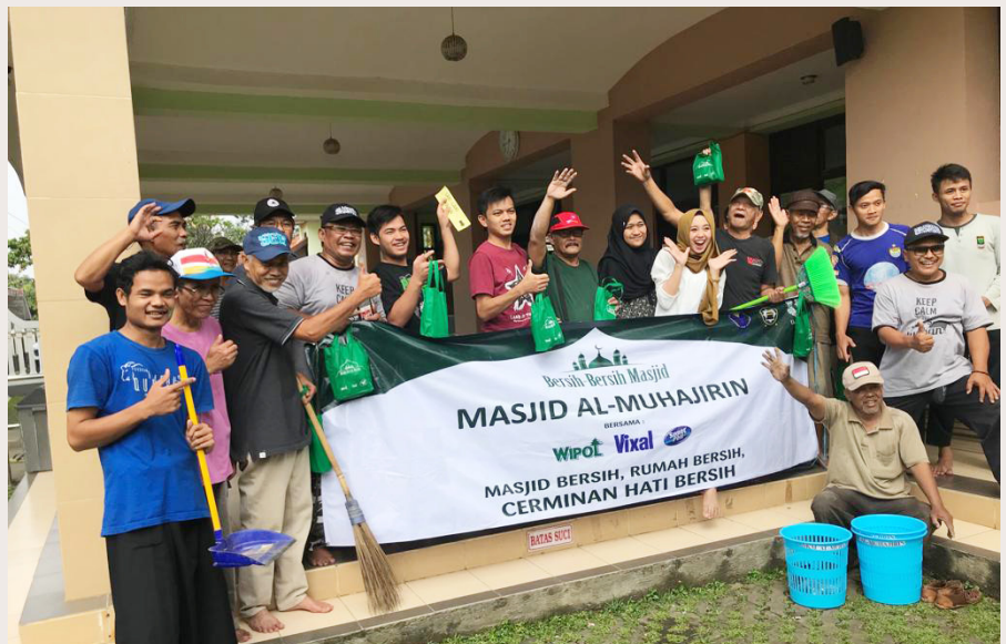
Kilas Balik GMB sejak 2017