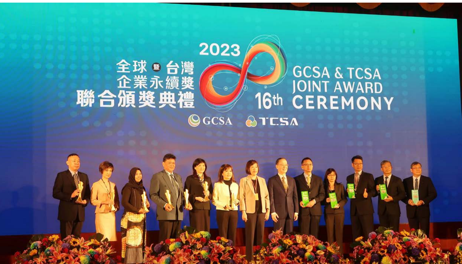
Pertamina raih 5 Penghargaan Internasional pada Kompetisi Keberlanjutan di Taiwan

Untuk sektor panas bumi, melalui PT Per-