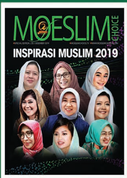
IKLAN BACK COVER FC Rp. 75.000.000