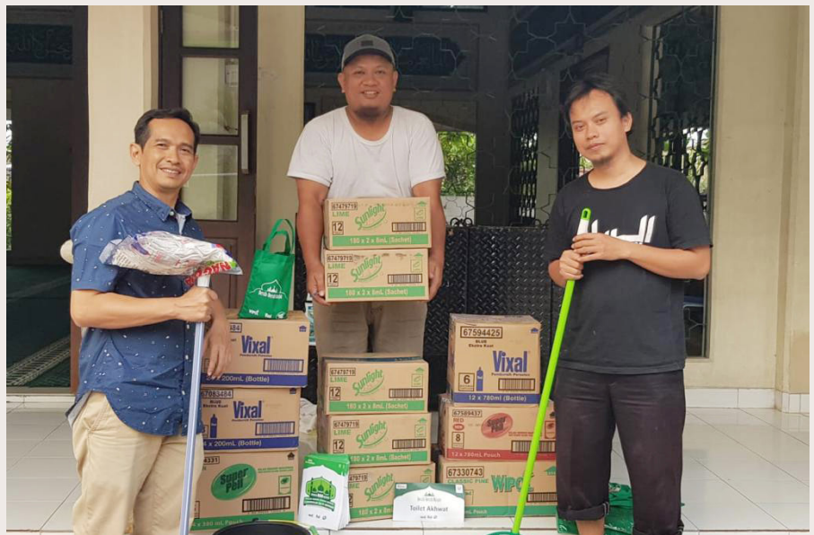
Kilas Balik GMB sejak 2017