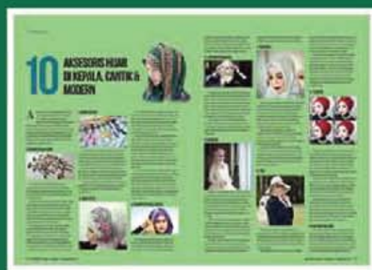
IKLAN CENTER SPREAD FC Rp. 80.000.000