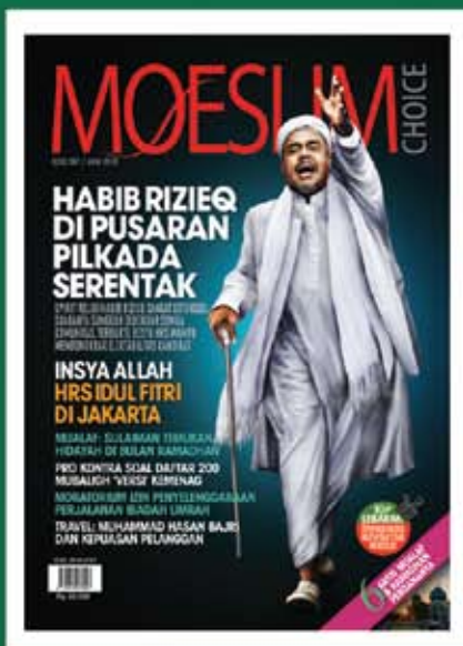
IKLAN BACK COVER FC Rp. 75.000.000