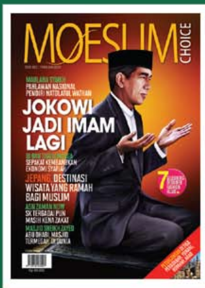
IKLAN 1 HALAMAN FC Rp. 50.000.000