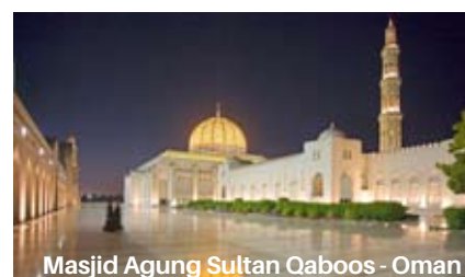
Masjid Agung Sultan Qaboos - Oman