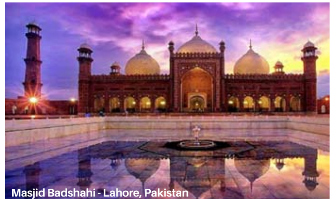
Masjid Badshahi - Lahore, Pakistan