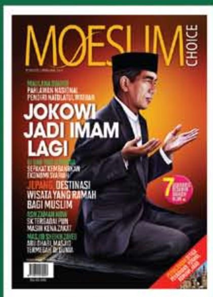
IKLAN 1 HALAMAN FC Rp. 50.000.000