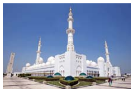
Masjid Agung Sheikh Zayed - UAE