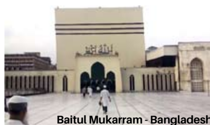
Baitul Mukarram - Bangladesh