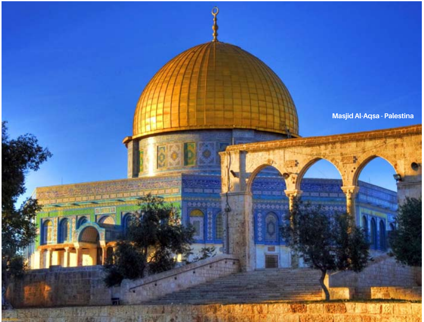
Masjid Al-Aqsa - Palestina