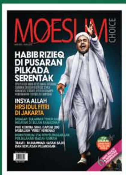
IKLAN BACK COVER FC Rp. 75.000.000