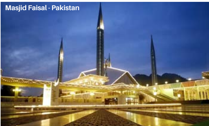
Masjid Faisal - Pakistan

Selain masjid Faisal, Pakistan juga memiliki masjid besar dan indah lainnya. Masjid ini diklaim sebagai masjid terbesar kedua di