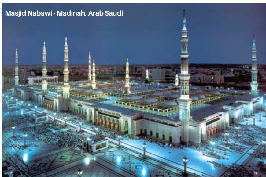
Masjid Nabawi - Madinah, Arab Saudi