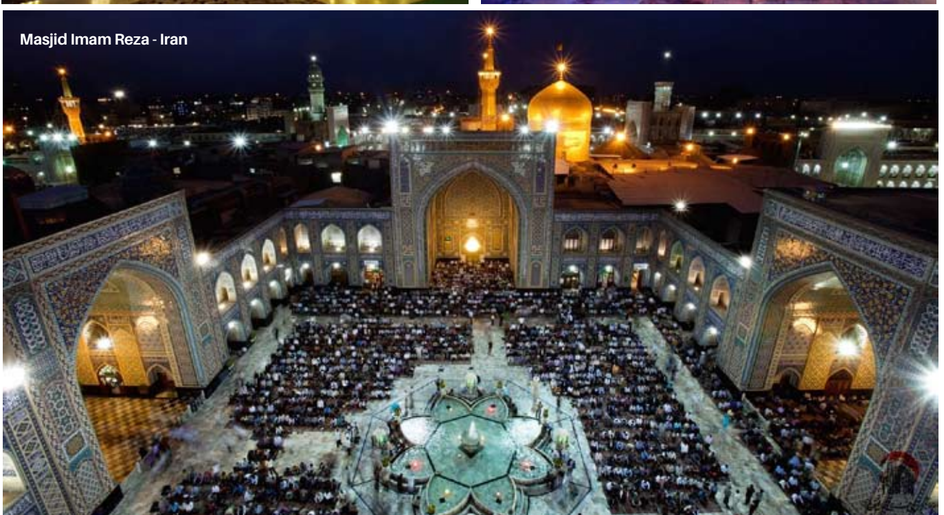
Masjid Imam Reza - Iran