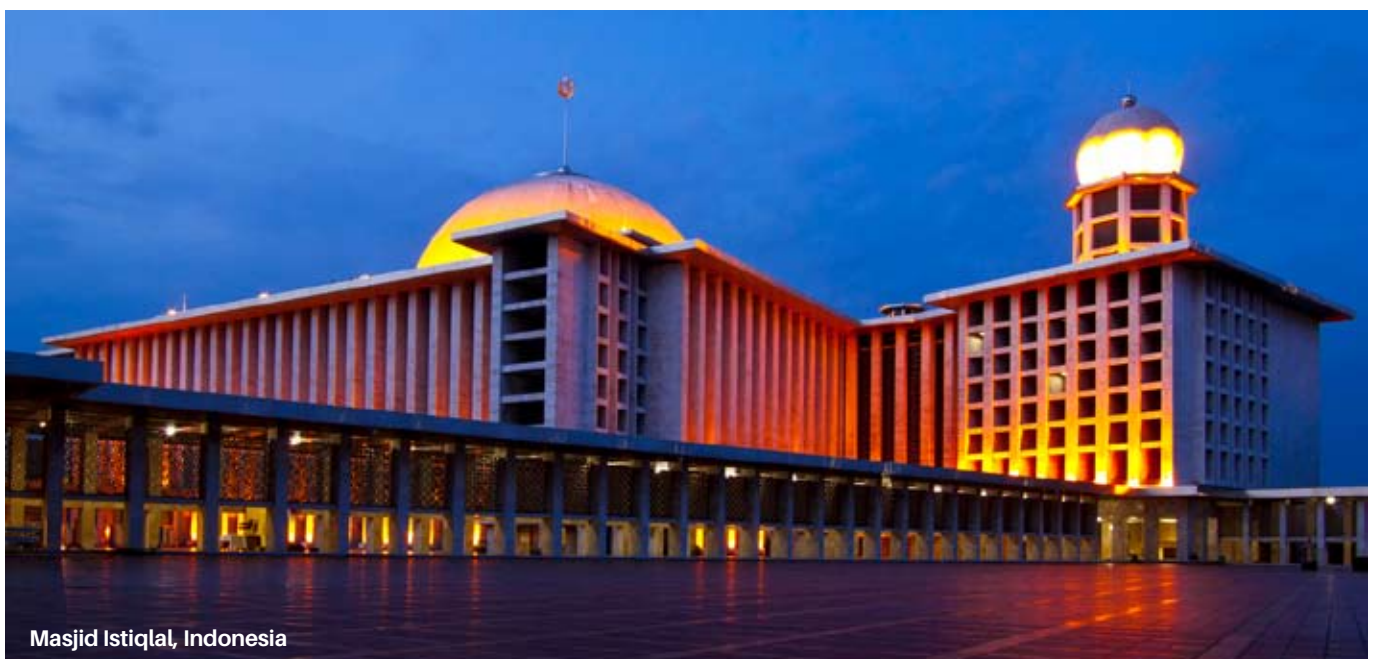
Masjid Istiqlal, Indonesia

Masjid yang berlokasi di kota Delhi ini mampu menampung jamaah hingga 25 ribu jamaah. Masjid ini sendiri dibangun pada masa pemerintahan kaisar Mughal Shah Jahan dari tahun 1650 dan selesai pada 1656. Menariknya, masjid ini memiliki beberapa