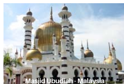
Masjid Ubudiah - Malaysia