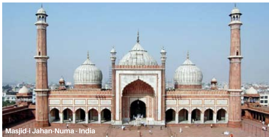
Masjid-i Jahan-Numa - India

Terdiri dari empat menara dan kubah emas, Masjid Ubudiah dirancang oleh arsitek asal Inggris, Arthur Benison Hubback atas perintah dari Sultan Idris Mushidul Azam