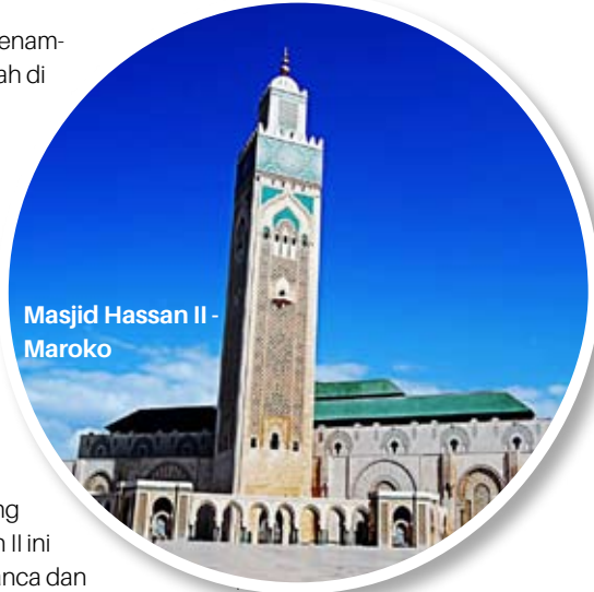
Masjid Hassan II - Maroko

Masjid Istiqlal merupakan salah satu masjid yang patut dibanggakan. Masjid ini memiliki menara yang tinggi dan indah serta