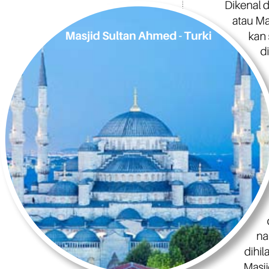
Masjid Sultan Ahmed - Turki