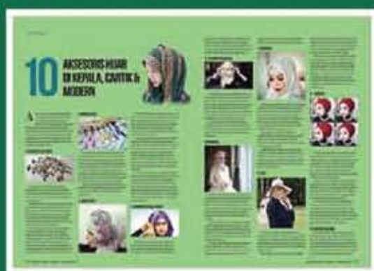
IKLAN CENTER SPREAD FC Rp. 80.000.000