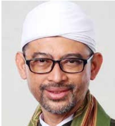
OLEH: LUTHFI BASHORI

Pengasuh Pondok Pesantren Ribath Al-Murtadla Al-Islami, Singosari, Malang