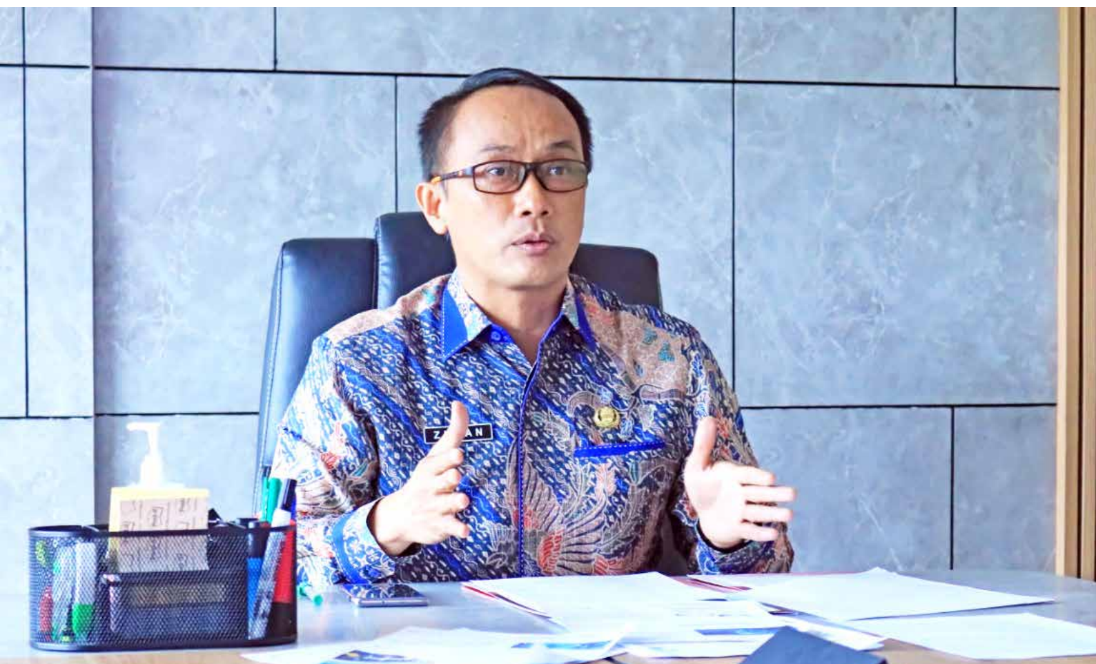
Direktur Jenderal Kependudukan dan Pencatatan Sipil Kementerian Dalam Negeri, Zudan Arif Fakrullah

"Oleh karena itu, edukasi kepada seluruh masyarakat oleh kita semua untuk tidak mudah menampilkan data diri dan pribadi di media online apapun sangat perlu dilakukan," ujarnya. ♦