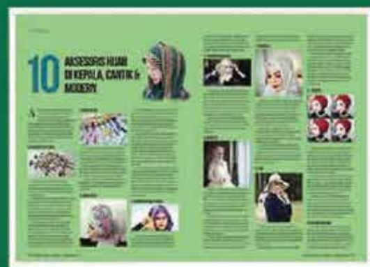
IKLAN CENTER SPREAD FC Rp. 80.000.000