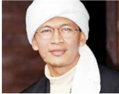
OLEH: KH. ADULLAH GYMNASIAR (AA GYM)

Sebagai contoh, ada seseorang yang sakit pinggang dan belum sempat memeriksakan dirinya ke dokter. Kemudian, dia menceritakan hal itu kepada temannya. Dia menduga-duga bahwa dia sedang