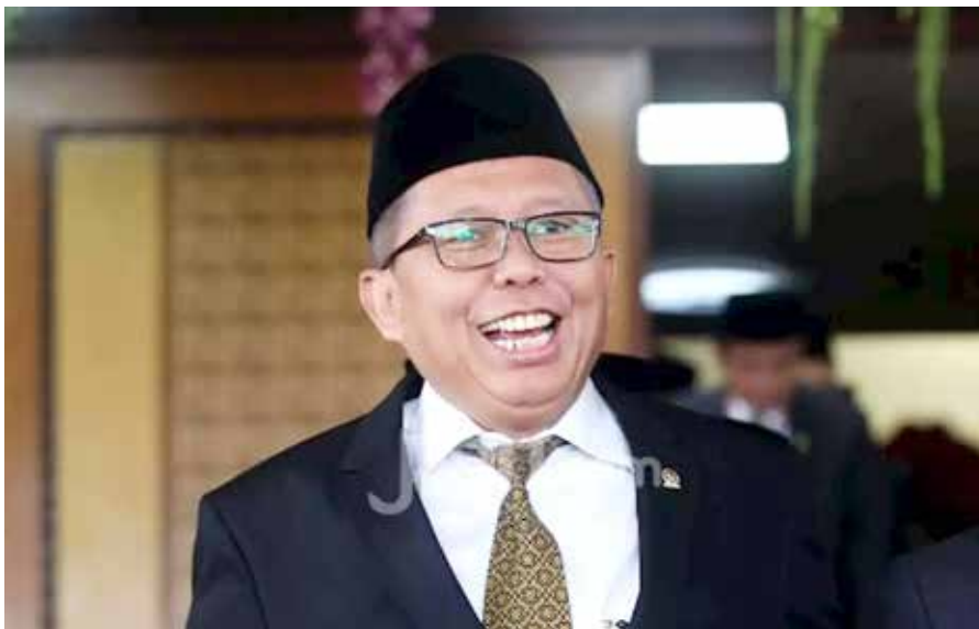
Wakil Ketua MPR RI Arsul Sani

Santri Developer Kebangsaan Batch 2 merupakan program pelatihan di bidang perumahan dan property yang dilakukan NU Circle dengan didukung sepenuhnya oleh Bank BTN. Program ini senantiasa dilakukan di basis-basis pesantren dengan melibatkan berbagai pihak termasuk peserta dari berbagai agama agar saling mengenal dan memperkuat kebangsaan. ♦tyo