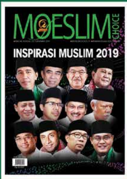
IKLAN 1 HALAMAN FC Rp. 50.000.000