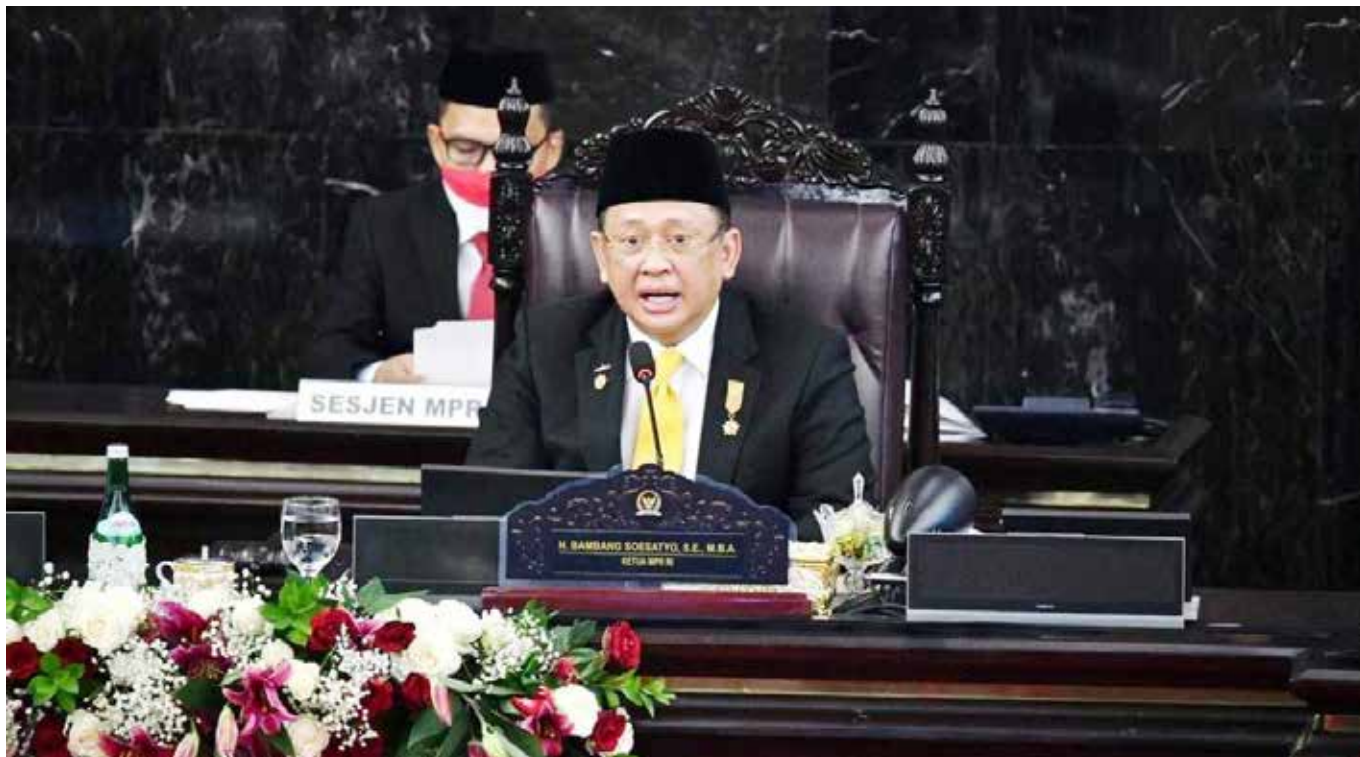
Ketua MPR RI Bambang Soesatyo