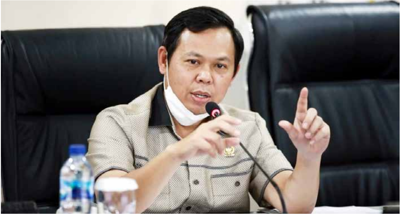
Wakil ketua Dewan Perwakilan Daerah (DPD RI) Sultan B Najamudin