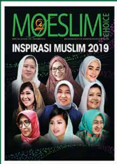
IKLAN BACK COVER FC Rp. 75.000.000