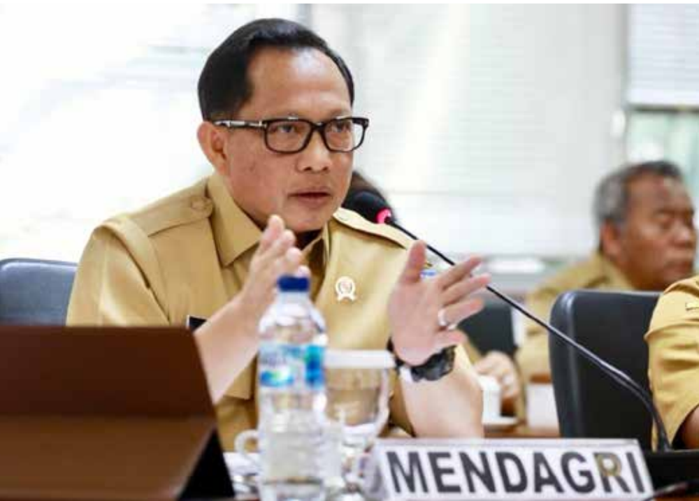
Menteri Dalam Negeri Muhammad Tito Karnavian.

"Saya sangat yakin banyak sekali kepala daerah yang berprestasi, yang telah melakukan kinerja dengan sangat baik, namun apa pun juga, masalah-masalah hukum yang dalam bulan ini ditangani oleh penegak hukum, wabil khusus KPK, ini akan berdampak kepada kepercayaan publik," tandasnya. ♦