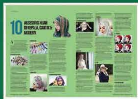
IKLAN CENTER SPREAD FC Rp. 80.000.000