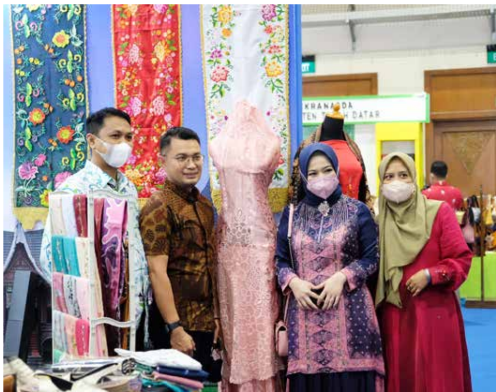
UMK Padang Panjang ikut tampil di Inacraft 2022

Kepala BPJPH Muhammad Aqil Irmah menegaskan bahwa sejak 17 Oktober 2019, sertifikasi halal telah diwajibkan bagi produk yang masuk, beredar dan dipergunakan di wilayah Indonesia, sesuai amanat UU 33/2014 tentang Jaminan Produk