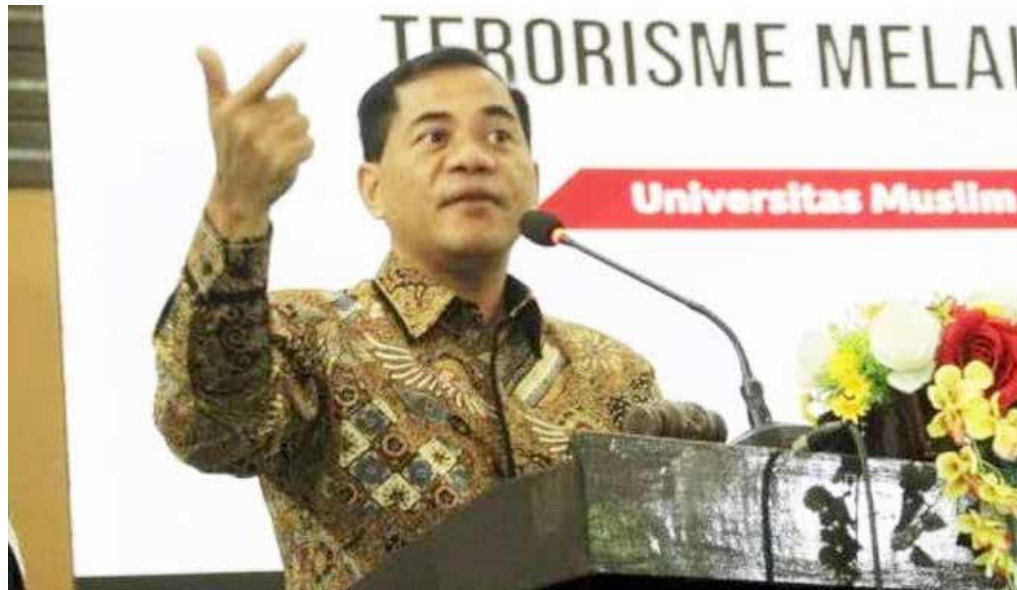
Badan Nasional Penanggulangan Terorisme, Brigadir Jenderal Ahmad Nurwakhid

Toh menjelang Ramadan 1443 hijri tahun ini, memang ada peristiwa penceramah batal menyampaikan materinya. Antara lain dalam kegiatan Pameran MuslimLife Fair