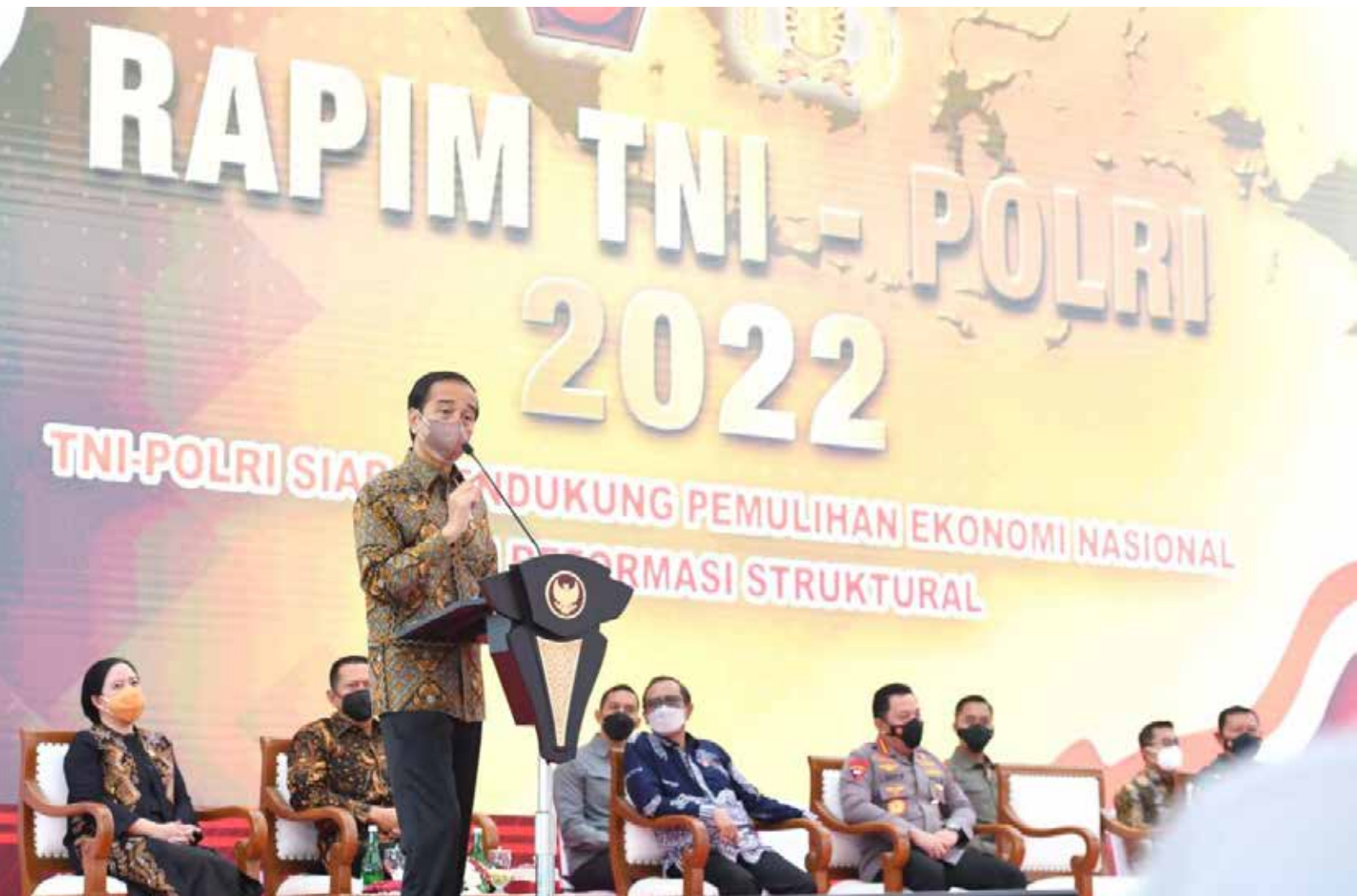
Presiden Joko Widodo dalam acara RapiM TNI-POLRI.