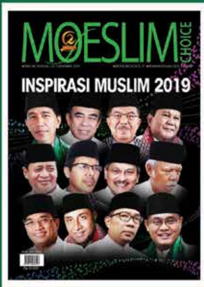
IKLAN 1 HALAMAN FC Rp. 50.000.000