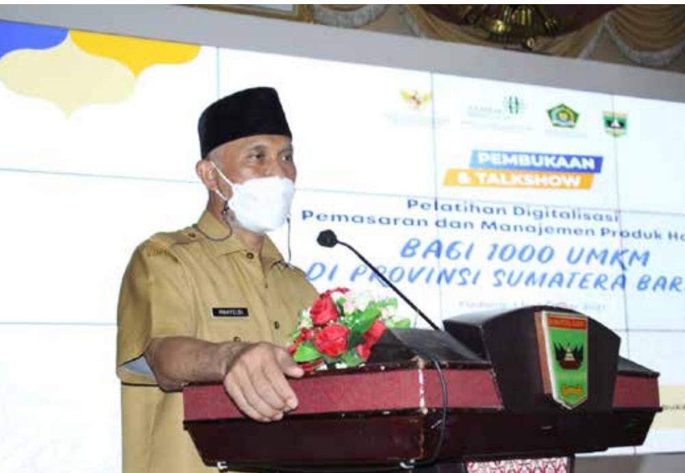
Gubernur Sumbar Mahyeldi

Dilanjutkan Mahyeldi, salah satu cara meningkatkan pendapatan masyarakat yang paling cepat jika dikolaborasikan