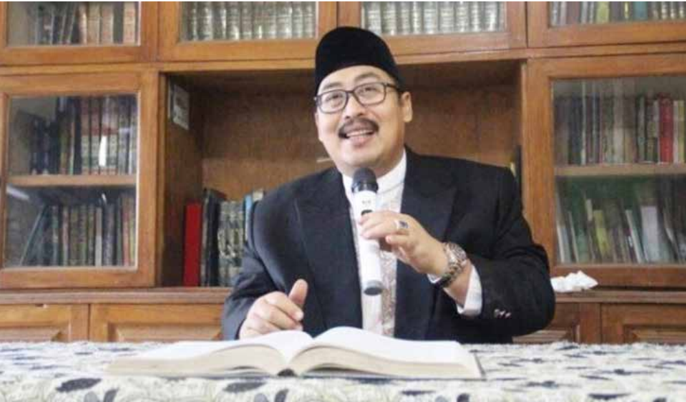
Ketua Pengurus Besar Nahdlatul Ulama (PBNU) Ahmad Fahrurrozi

Lebih lanjut, anggota Komisi Sosial DPR ini menyebut pangkal radikalisme adalah ketidakadilan, baik di bidang hukum, ekonomi, sosial, dan politik. Tidak hanya itu, hilangnya kesejahteraan dan rasa aman serta munculnya rasa keterasingan di negeri sendiri juga turut berkontribusi terhadap