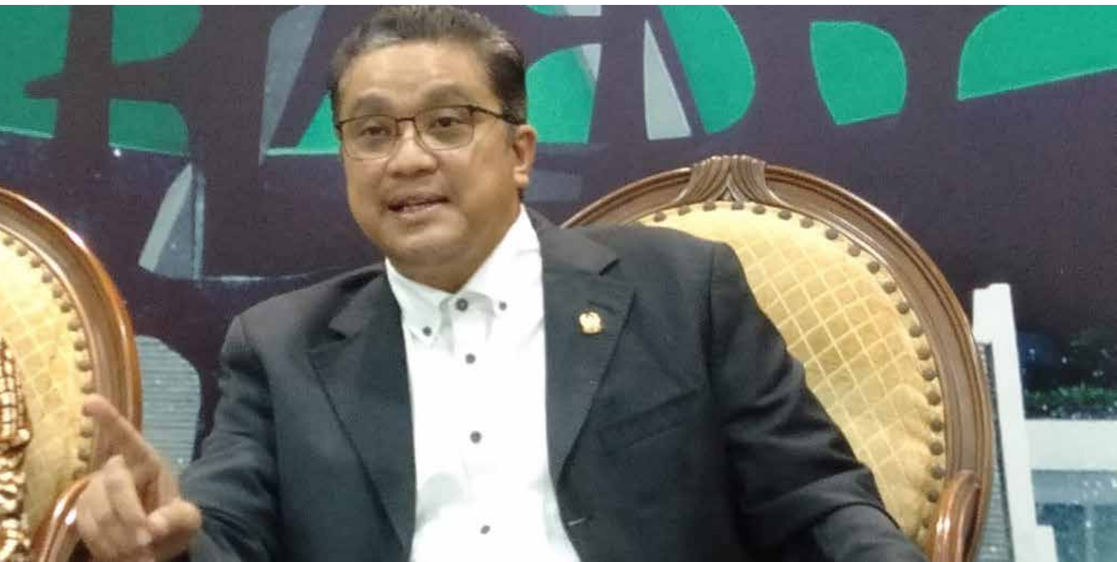
Wakil Ketua Komisi X DPR RI Fraksi Partai Demokrat Dede Yusuf