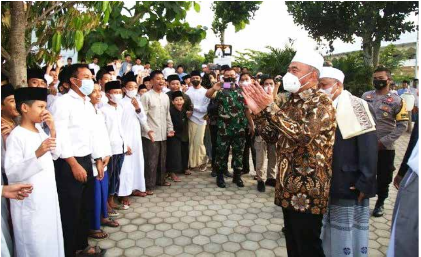
Menko PMK, Muhadjir Effendy saat berkunjung ke salah satu pesantren di Lombok, NTB_dokpmk

ungkap Menko PMK bahwasanya bukan semata persoalan anggaran tetapi juga masalah kelangkaan sumber daya termasuk kualitas perangkat desa yang masih kurang serta kondisi spasial wilayah terutama yang masih terisolasi.