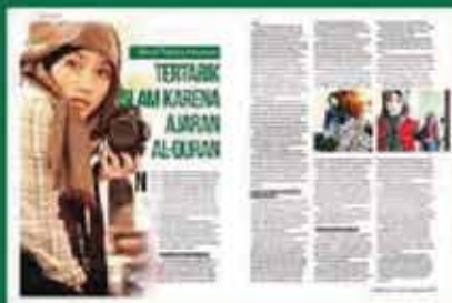
IKLAN 1/2 HALAMAN FC Rp. 25.000.000

Media Yang Tepat Untuk Promosi Usaha Anda