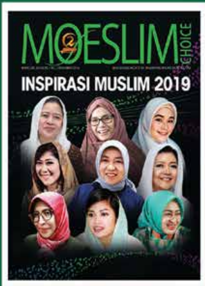
IKLAN BACK COVER FC Rp. 75.000.000