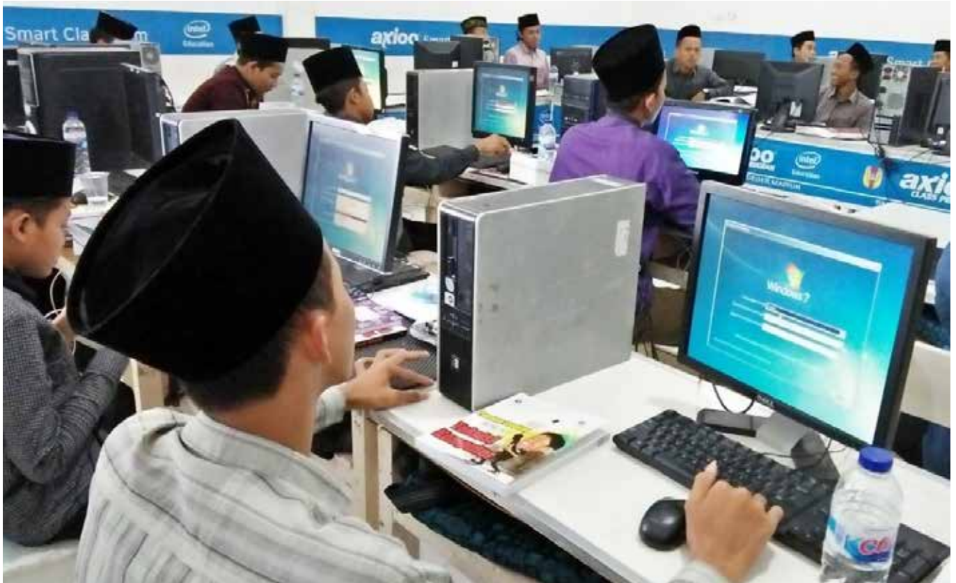
Santri Kuasai Ilmu Pengetahuan.